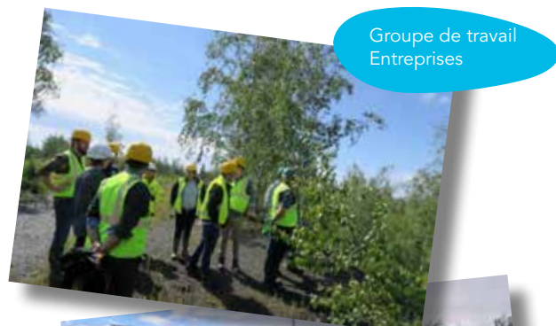
Groupe de travail Entreprises