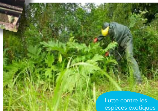
Lutte contre les espèces exotiques envahissantes