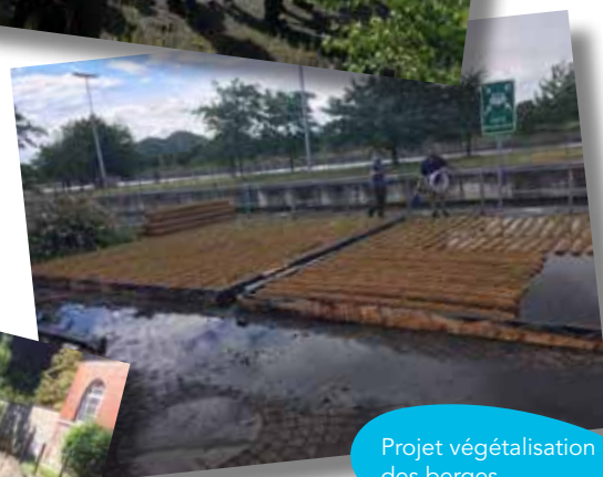
Projet végétalisation des berges