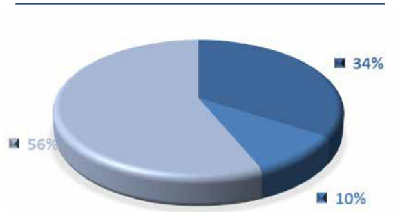
PROGRAMME D' ACTIONS 2020-2022